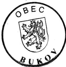
kulaté razítko obce